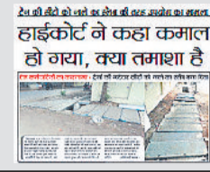
2x भी सीटें को उतार कर नाले के स्केब का इस्तेमाल किया जा रहा है। हाईकोर्ट ने कहा कबाड़ को उतार दिया, क्या तमाशा है

हरिभूमि की खबर को हाईकोर्ट ने स्वतः लिया था संज्ञान, मांगा था जवाब